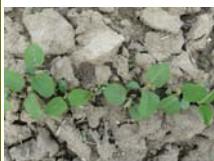
Abbildung 1: Soja-Keimpflanzen

Das LFZ Raumberg-Gumpenstein hat seit 2010 verschiedene Versuche auf Praxisbetrieben durchgeführt, um für jedes Anbaugelände die jeweils am besten geeigneten Sorten herauszufinden. Daneben ging es noch um weitere wichtige Fragen wie optimale Kulturführung, im Speziellen um die effektivste Unkrautbekämpfung.