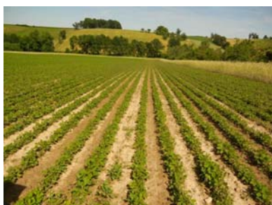
Abbildung 5: Niederneukirchen- Bestand Mitte Juni, wenig Unkraut