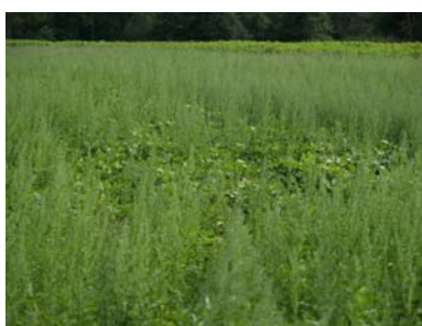
Abbildung 7: Total verunkrauteter Sojabestand mit Weißem Gänsefuß

Stark verunkrautete Felder bedeuten für die Sojapflanzen Konkurrenz, was sich meist in einem geringeren Ertrag bemerkbar macht.