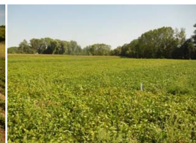
Abbildung 6: Mauthausen- Bestand schön, einzelne Unkrautnester