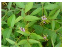
Abbildung 2: Sojablüten