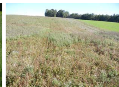
Abbildung 8: Verunkrautung mit Disteln