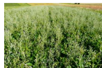
Abbildung 10: Untersaat mit Kresse