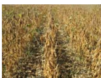
Abbildung 3: Reifer Sojabestand