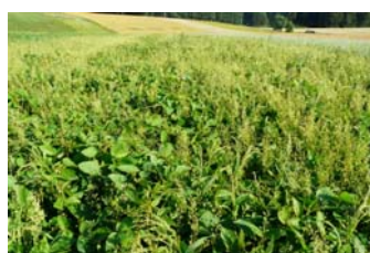
Abbildung 9: Untersaat mit Leindotter

Ob der Anbau von Sojabohnen eher mit einem Reihenabstand erfolgt, der eine Hackarbeit zulässt, oder in Drillsaat, bleibt dem Anbaumanagement des jeweiligen Landwirtes überlassen. Da es bei der Drillsaat später keine Regulierungsmöglichkeit mehr gibt, bleibt nur die Alternative mit einer Untersaat oder die Direktsaat in einen schon bestehenden überwinternden Pflanzenbestand.