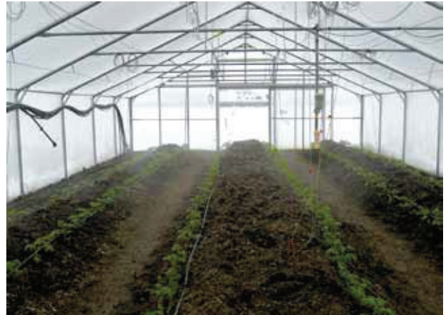
Forschungsprojekt am Zinsenhof: während draußen noch der Schnee liegt, wachsen drinnen im Folienhaus schon Tomaten am warmen Damm

Zahlreiche Materialien und Materialkombinationen wurden während des Projektes getestet. Besonders interessant erschienen Hanfschäben, Pferdemit (frisch) und Mischungen aus verschiedenen Materialien. Das Material muss in einer ausreichenden Menge zu Dämmen aufgeschüttet werden (Durchmesser 40–50 cm), siehe Abbildung 1. Erst durch N-Zufuhr und durch Befeuchtung startet innerhalb von 2–3 Tagen der Erwärmungseffekt.