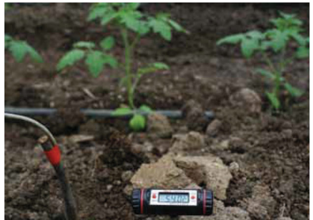
Im Inneren des Dammes bilden sich durch mikrobielle Umsetzung der organischen Materialien Temperaturen von bis zu 55°C