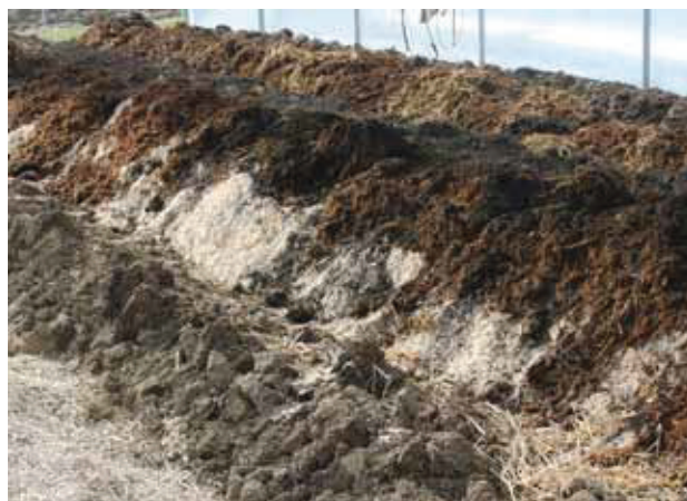
Forschungsprojekt am Zinsenhof: die Dämme bestehen aus einer Mischung verschiedener frischer organischer Materialien wie Pferdemist, Stroh, Hanfschäben und etwas fertigem Kompost.

Ähnlich wie die Mistbeetkästen funktionierten auch Treiblöcher, Glocken, Papierhauben oder Glaszelte.