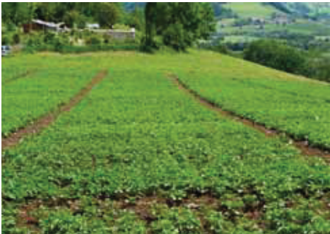
Sortenversuch am Moarhof (Trautenfels) Mitte Juni 2012, Übersicht über Versuchsschlag

Vorfrucht: Klee gras Bodentyp: Pseudogley Klima: 7,0° Jahresdurchschnitts- temperatur, 1010 mm Niederschlag Versuchsanlage: Exakt-Parzellenversuch Aussaat: 02.05.2012 Beikrautregulierung: Häufelgerät, Hackel Ernte: 18.09.2012 Versuchsbetreuung: Hein/Waschl