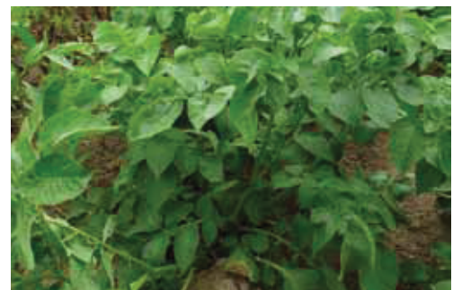
Sorte Alonso am Moarhof (Trautenfels) Anfang Juli, noch gesund neben bereits befallenen Kartoffelsorten

Dieser Sortenversuch wurde Anfang Mai 2012 angebaut und zeigte einen raschen Aufgang. Die Jugendentwicklung verlief gut und Ende Juni präsentierte sich der Bestand sehr schön. Leider änderte sich dieses Bild durch einen massiven Krautfäulebefall Anfang Juli, der vor allem die Frühsorten stark beeinträchtigte. Einzig die Sorten Alonso und Prinzess zeigten nur einen geringen Befall. Im Juli kam dann noch ein mittlerer Befall mit Colletotrichum coccodes dazu, weshalb Ende Juli das Kraut abgeschlägelt wurde. Die Erträge sind teilweise bescheiden, allerdings bei den wenig befallenen Sorten recht zufriedenstellend. Die Größensortierung mancher Sorten hat unter dem starken Krankheitsbefall auch gelitten, wie der Ertragstabelle zu entnehmen ist.