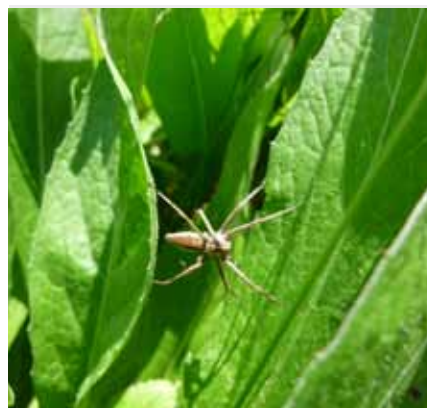
Spinnen sind als Räuber wichtige Nützlinge.