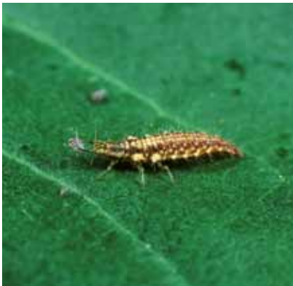
Die Larve einer Florfliege saugt Blattläuse aus.