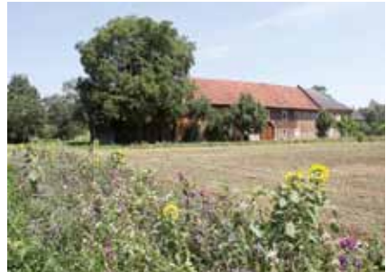
Blühstreifen vor einem Hof