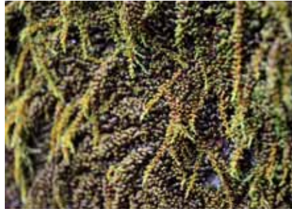
Algen und Pilze