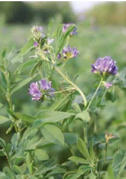
Luzerne und verschiedene Kleearten werden vor allem durch Wildbienen bestäubt. Honigbienen kommen mit diesen Blüten nicht so gut zurecht.