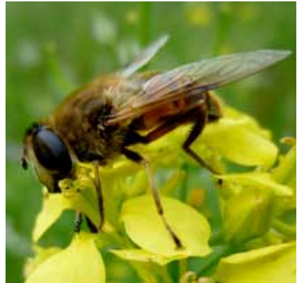
Die Larven der Schwebfliegen sind gefräßige Blattlausräuber.