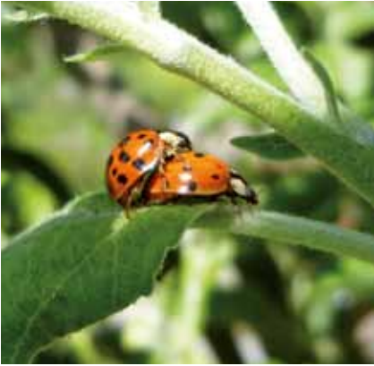
Marienkäfer bei der Paarung.