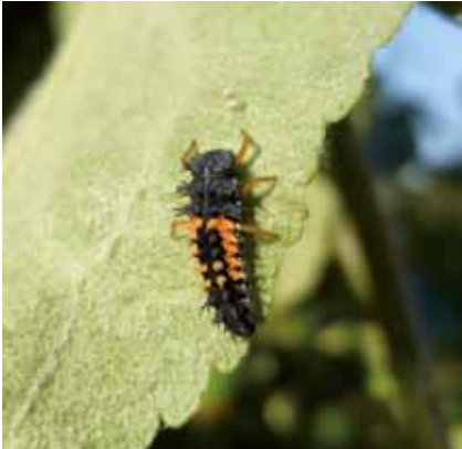
Larven von Marienkäfern fressen viele Blattläuse.