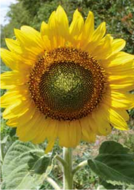
Wild- und Honigbienen können die Erträge bei Raps und Sonnenblumen um bis zu 30 % steigern.