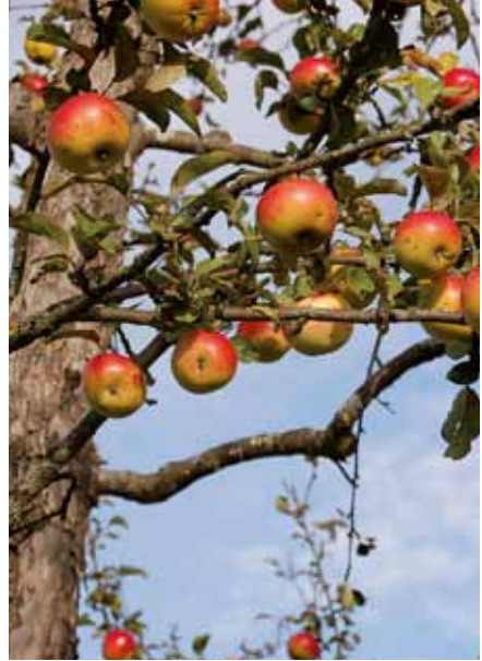
Bei fehlender Bestäubung kann es bei Äpfeln und Birnen zu Ertragseinbußen von bis zu 90 % kommen.