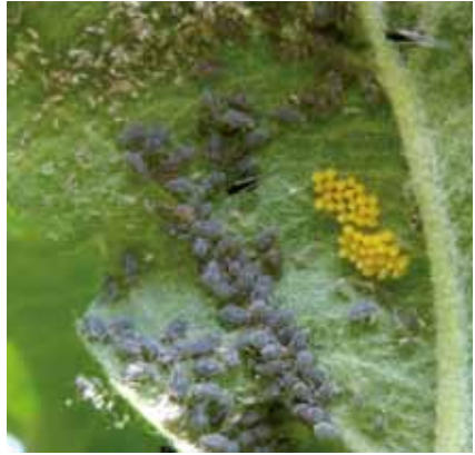
Marienkäfer-Eier direkt in einer Blattlauskolonie.