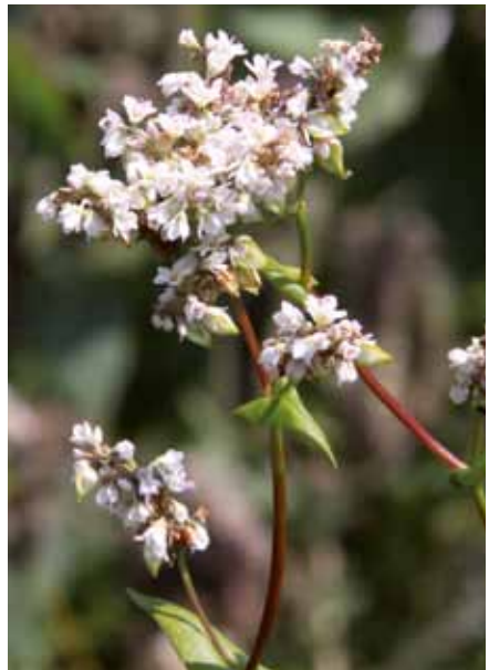
Bei Buchweizen beträgt der Ertrag ohne bestäubende Insekten nur etwa 25 % im Vergleich zu gut bestäubten Kulturen.