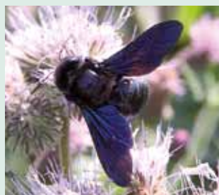
Holzbiene (Xylocopa sp.)

Nur die etwa 40 heimischen Hummelarten – die auch zu den Wildbienen zählen – sind sozial lebend. Wie Honigbienen leben sie in Staaten mit Arbeitsteilung und Brutpflege. Allerdings finden sich, je nach Art, nur maximal 500 Hummeln in einem Stock.